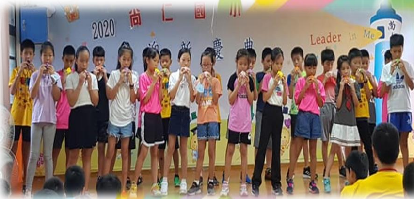
四年級學長姊為新生吹奏老烏鴉、甜蜜的家庭