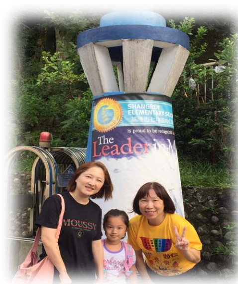
校長在校門燈塔迎接小小新鮮人