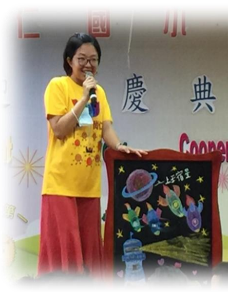
導師手繪精緻圖板說故事