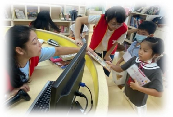
闖關活動: 認識圖書館