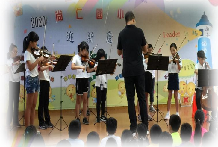
弦樂社開啟迎新的序幕