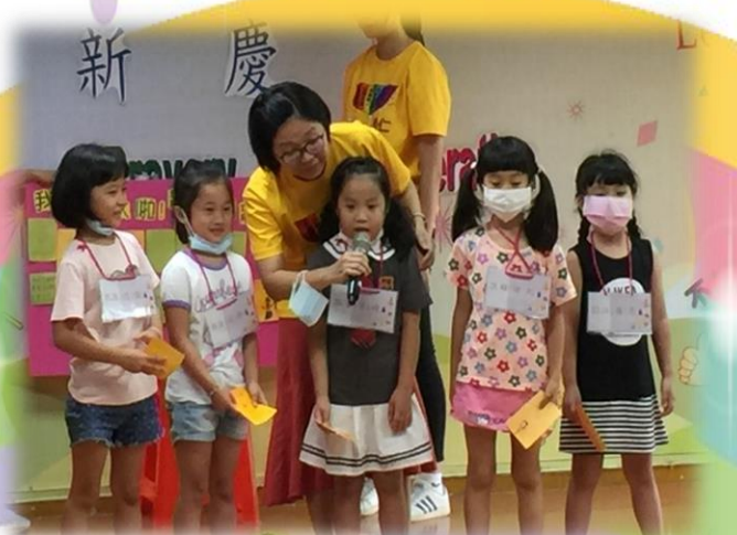
小小新鮮人上台自我介紹