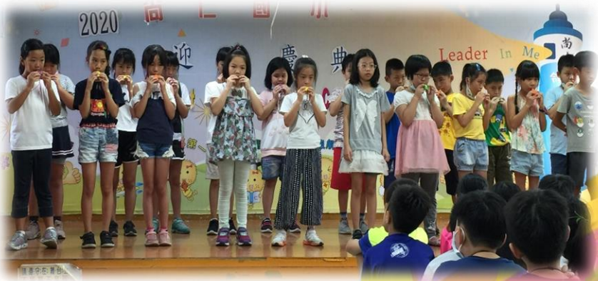
三年級學長姊為新生吹奏河水