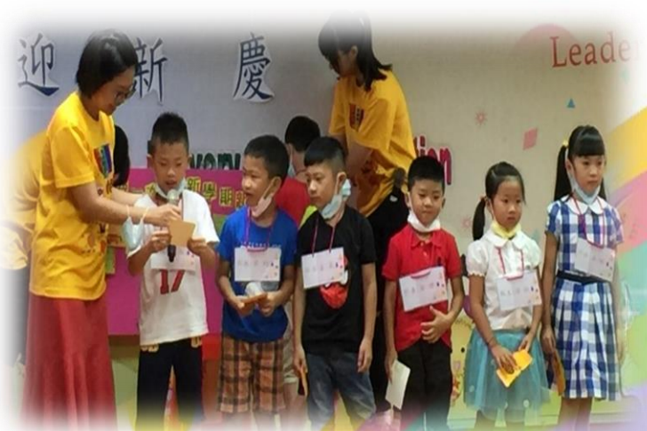
小小新鮮人上台自我介紹