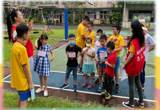
闖關活動: 注意遊戲安全