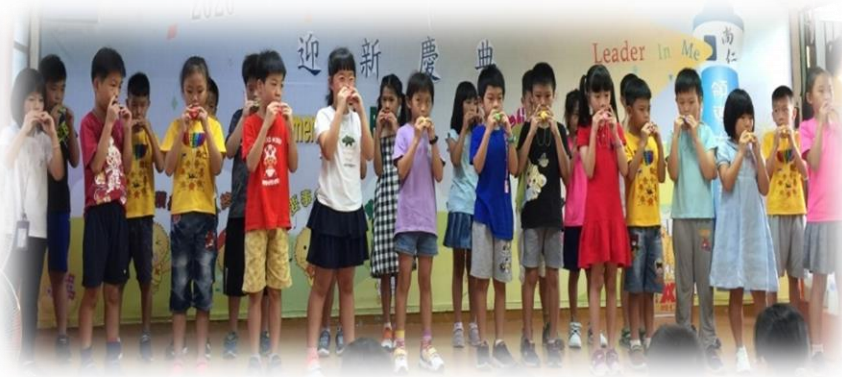
二年級學長姊為新生吹奏小蜜蜂、小星星、布穀