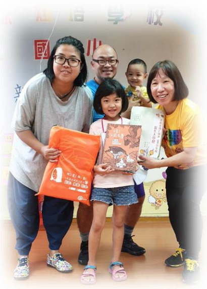
致贈小小新鮮人入學禮