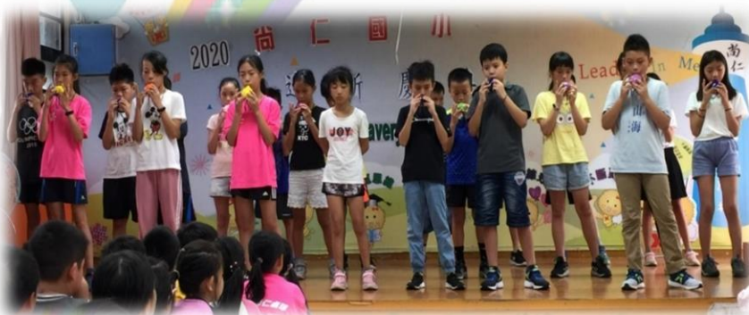
五年級學長姊為新生吹奏王老先生有塊地、快樂人生