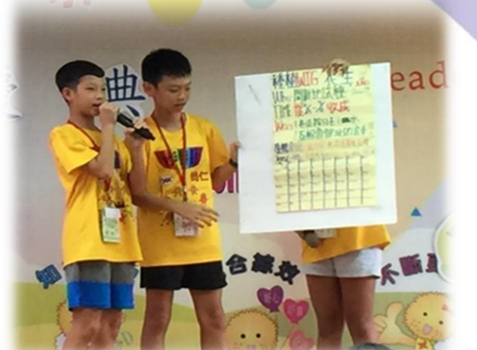
六年級學長姐用小短劇介紹七習慣