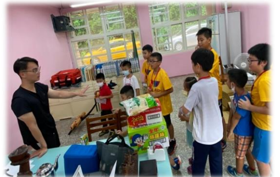
闖關活動: 認識健康中心