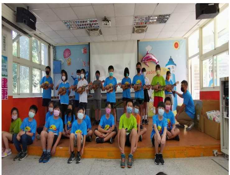
六年級學長姊為學弟妹表演 表演曲目：白月光與硃砂