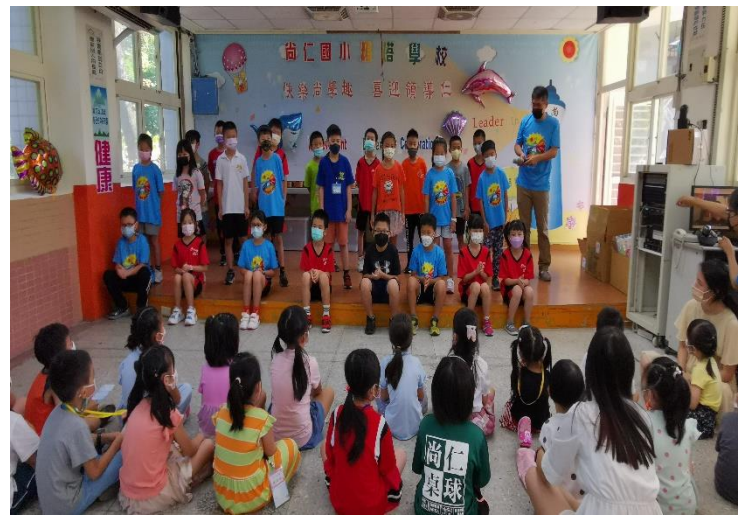
三年級學長姊為學弟妹表演 表演曲目：幸福的臉