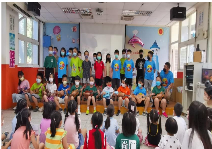
四年級學長姊為學弟妹表演 表演曲目：小小世界