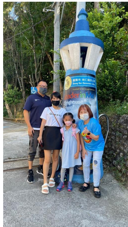
時光隧道，歡迎小小新鮮人