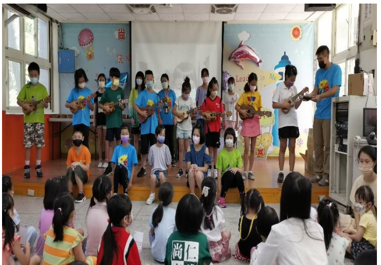
五年級學長姊為學弟妹表演 表演曲目：喔！蘇珊娜