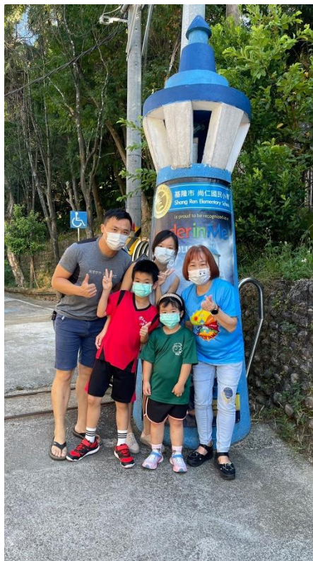
校長與小小新鮮人合照