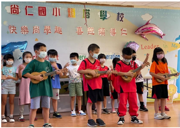
二年級學長姊為學弟妹表演 表演曲目：小星星