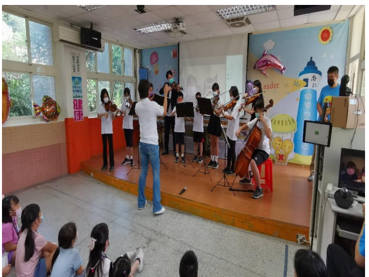
弦樂社精采絕倫超專業演出 表演曲目：1. 韋瓦第 Vivaldi Rocks 2. Baby Shark Dance